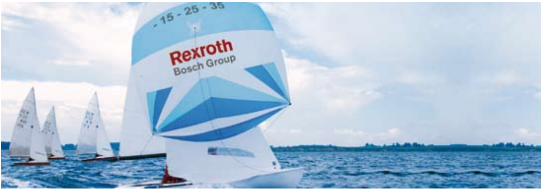
► Bosch Rexroth - det mest innovative D&C selskapet i Norge.